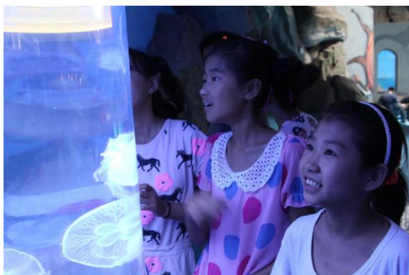
极地海洋世界游玩