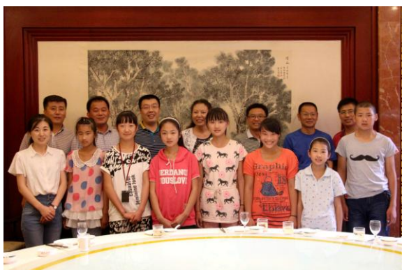
中能电力与中实易通领导与孩子们共进晚餐