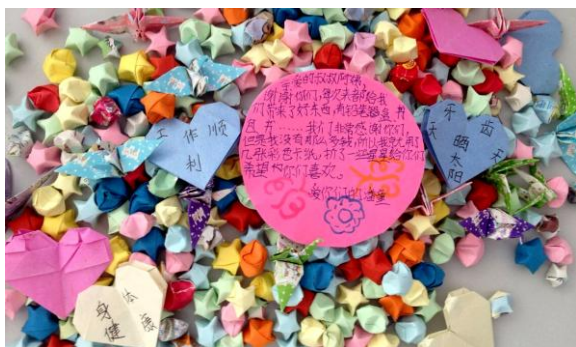
孩子们精心准备的礼物