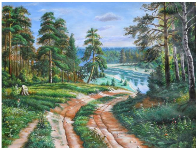
崔宪廷油画作品——《乡路》