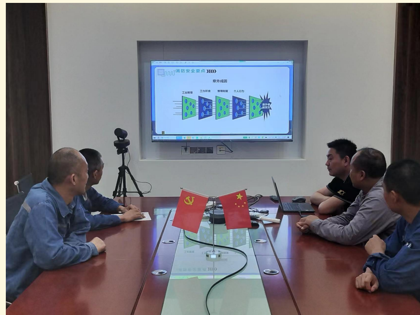
安全知识大讲堂之安全用电篇