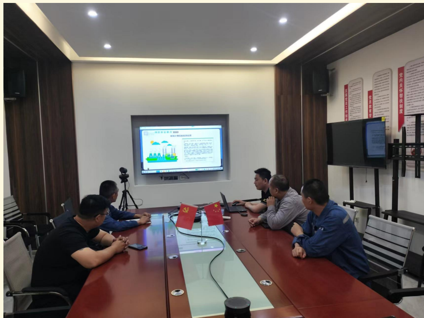
安全知识大讲堂之安全用电篇