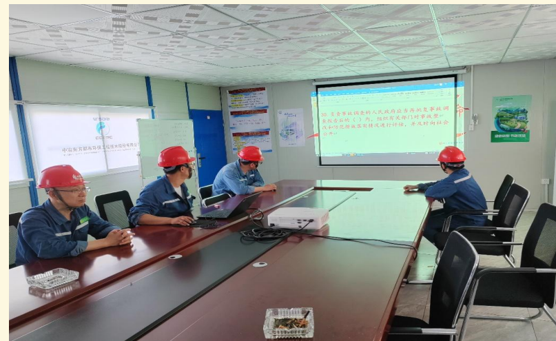
项目安全知识竞赛