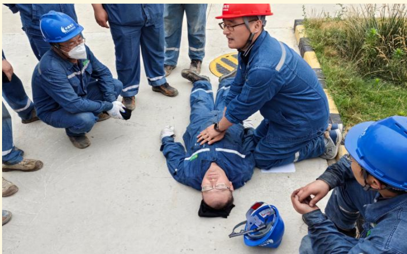
火灾逃生应急演练