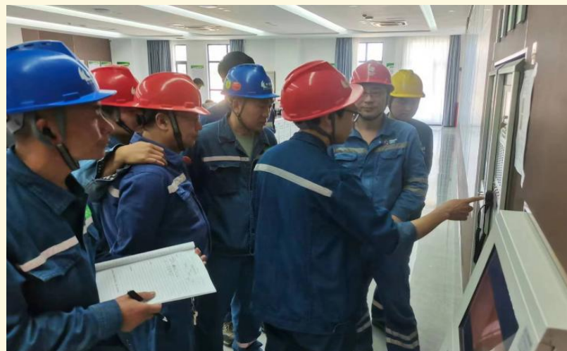
消防安全技能培训